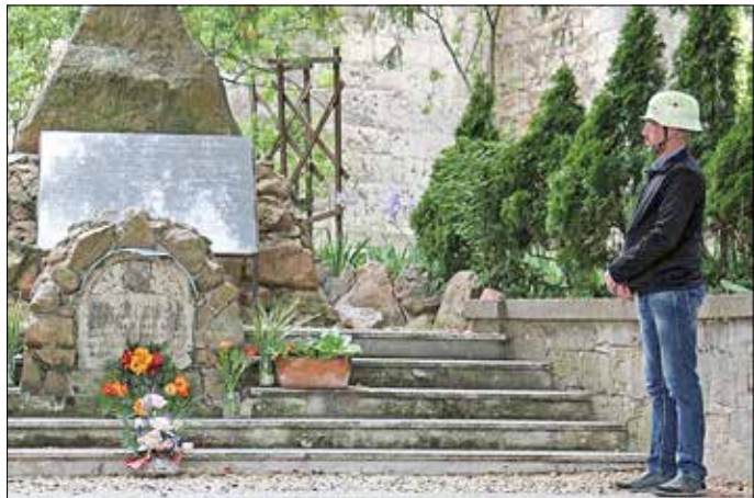
Am Pfingstsonntag gedachten die Gottesdienstbesucher den Opfern beider Weltkriege