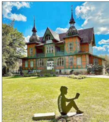
Fotopoint Kurschatten im Kurpark