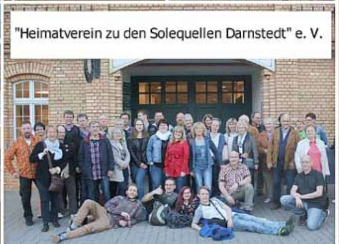
"Heimatverein zu den Solequellen Darnstedt" e. V.

zen. Deshalb an dieser Stelle ein großes Dankeschön an alle fleißigen Helfer!