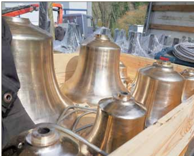
Anlieferung der Glocken