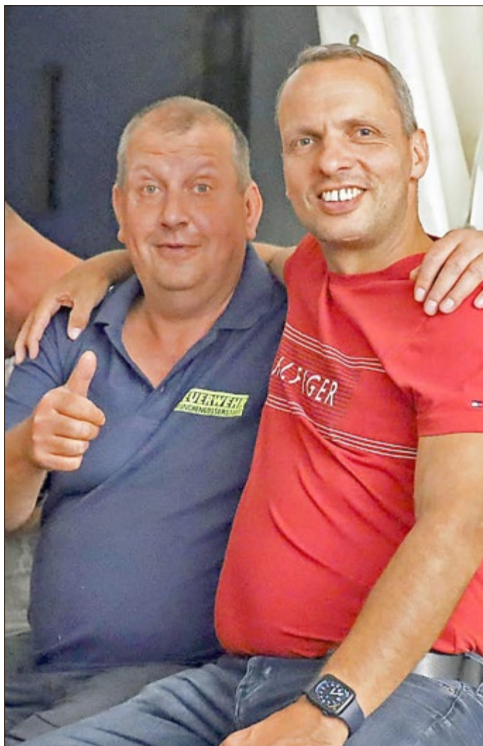
beide Wehrführer bei der Auswertung

Nur wenige Tage nach dem fulminanten Auftritt der Sängerinnen und Sänger des Lyric Opera Studios aus Weimar im Kirchgarten bereiteten die Kameraden unserer Feuerwehr das diesjährige Straßenkegeln vor und stellten vorab ein großes Zelt. Der Wetterbericht prognostizierte allerlei Unheil für den 26. August. Ein Posteinwurf informierte: „Einladung an alle zum Straßenkegeln - ab 13 Uhr - Dorfstraße Mügo - es winken Geldpreise - für das leibliche Wohl ist gesorgt - Hüpfburg für die Kleinen“.