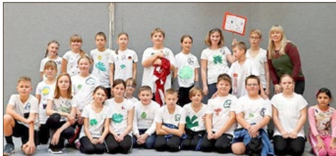
In der Kategorie „Klassen 5 bis 7“ belegten die Klasse 7b den 3. Platz, die Klasse 7a den 2. Platz und die Klasse 6b den 1. Platz.