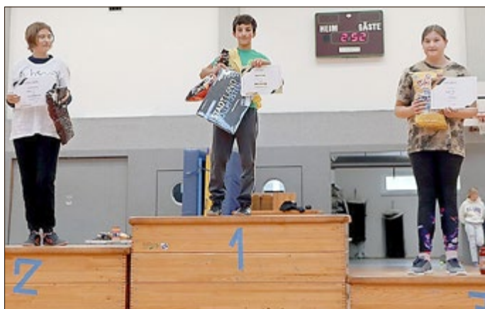
In der Kategorie „Klassen 8 bis 10“ belegten die Klasse 8a den 3. Platz, die Klasse 9a den 2. Platz und die Klasse 8b den 1. Platz.